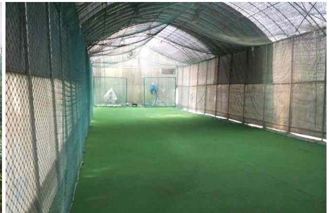
사면 위 불법시설물 내부