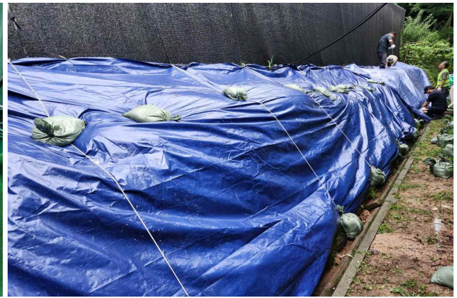
방수포 설치 22m